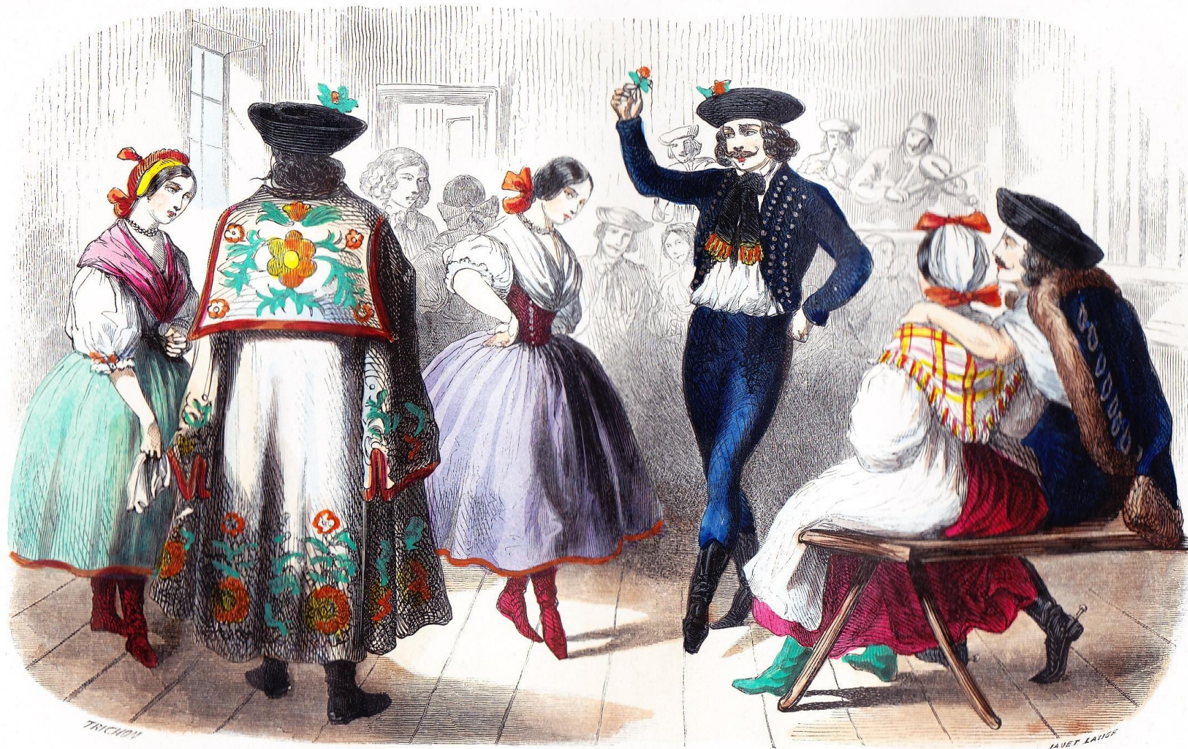
LES DANSEURS MAGYARS DANS UN CABARET.